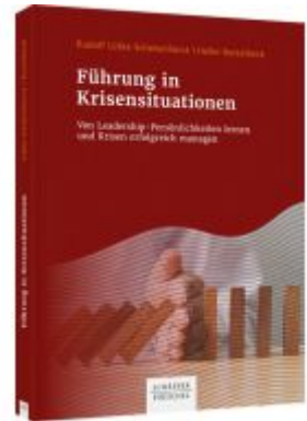
Führung in Krisensituationen Ladenpreis: 41,10EUR