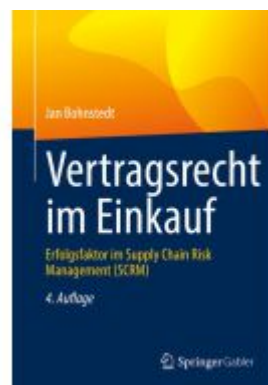
Vertragsrecht im Einkauf Ladenpreis: 51,39EUR