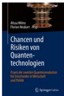
Chancen und Risiken von Quantentechnologien Ladenpreis: 61,68EUR