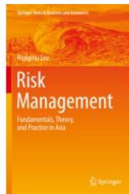
Risk Management Ladenpreis: 93,49EUR