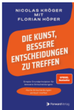
Die Kunst, bessere Entscheidungen zu treffen Ladenpreis: 15,00EUR