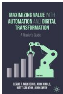
Maximizing Value with Automation and Digital Transformation Ladenpreis: 38,49EUR

Wir haben andere Produkte gefunden, die Ihnen gefallen könnten!