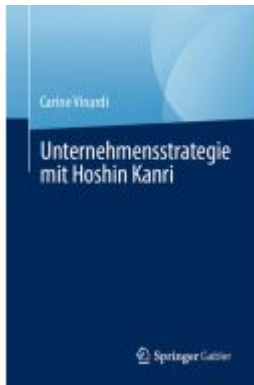
Unternehmensstrategie mit Hoshin Kanri Ladenpreis: 51,39EUR