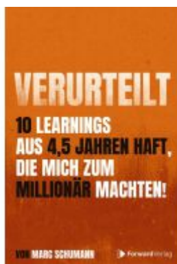
Verurteilt Ladenpreis: 18,00EUR