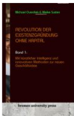
Revolution der Existenzgründung ohne Kapital Ladenpreis: 20,50EUR