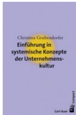
Einführung in systemische Konzepte der Unternehmenskultur Ladenpreis: 17,50EUR