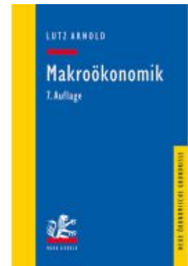
Makroökonomik Ladenpreis: 40,10EUR