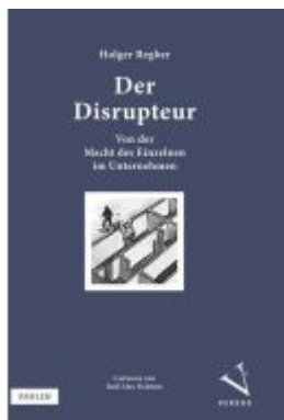
Der Disrupteur Ladenpreis: 25,60EUR

Wir haben andere Produkte gefunden, die Ihnen gefallen könnten!