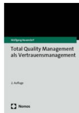
Total Quality Management als Vertrauensmanagement Ladenpreis: 112,10EUR