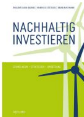
Nachhaltig investieren Ladenpreis: 64,90EUR