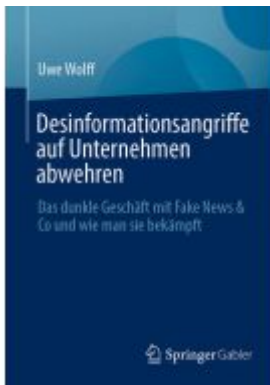
Desinformationsangriffe auf Unternehmen abwehren Ladenpreis: 61,67EUR