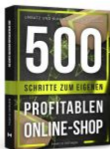
500 Schritte zum eigenen profitablen Online-Shop Ladenpreis: 19,90EUR