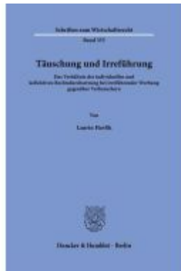
Täuschung und Irreführung Ladenpreis: 123,30EUR