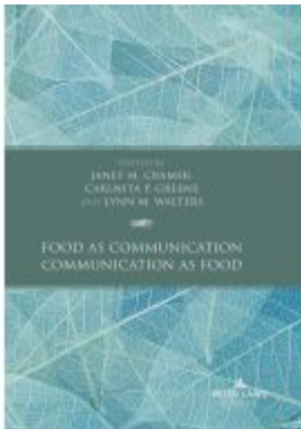
Food as Communication / Communication as Food Ladenpreis: 146,60EUR