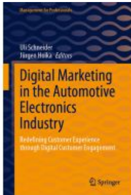
Digital Marketing in the Automotive Electronics Industry Ladenpreis: 93,49EUR

Wir haben andere Produkte gefunden, die Ihnen gefallen könnten!