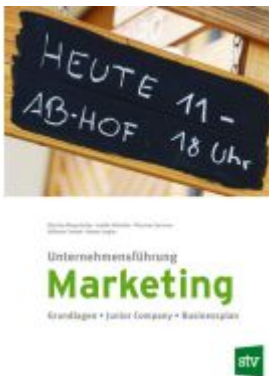
Unternehmensführung Marketing Ladenpreis: 15,59EUR