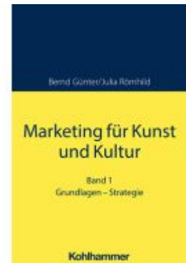
Marketing für Kunst und Kultur Ladenpreis: 46,30EUR