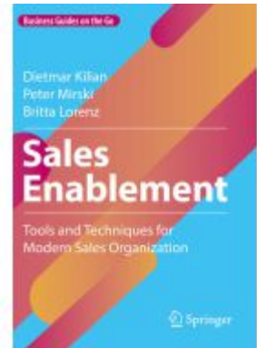
Sales Enablement Ladenpreis: 49,49EUR