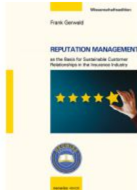
Reputation Management Ladenpreis: 30,90EUR