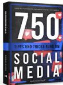
750 Tipps und Tricks rund um Social Media Ladenpreis: 19,90EUR