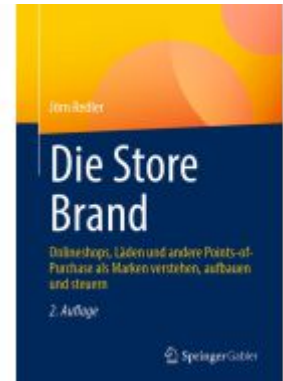
Die Store Brand Ladenpreis: 66,81EUR