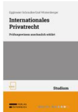
Internationales Privatrecht Ladenpreis: 38,00EUR