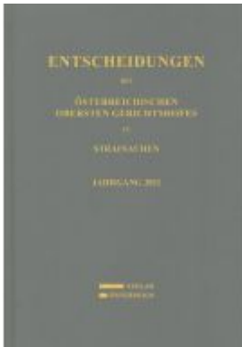
Entscheidungen des Österreichischen Obersten Gerichtshofes in Strafsachen Ladenpreis: 139,00EUR