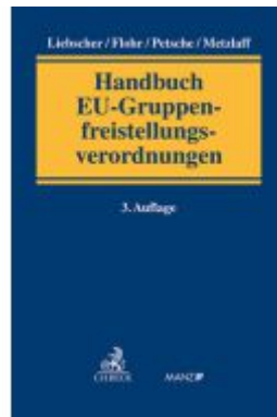
Handbuch der EU- Gruppenfreistellungsverordnung