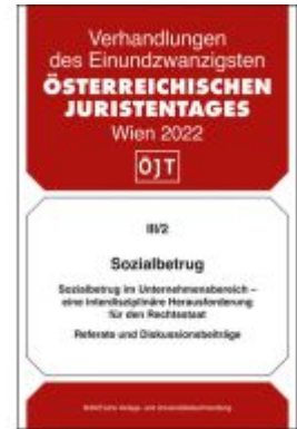
Sozialbetrug Ladenpreis: 29,00EUR