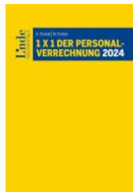
1 x 1 der Personalverrechnung 2024