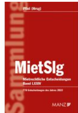
Mietrechtliche Entscheidungen MietSlg