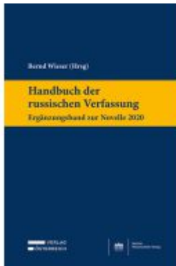
Handbuch der russischen Verfassung - Ergänzungsband zur Novelle 2020 Ladenpreis: 149,00EUR