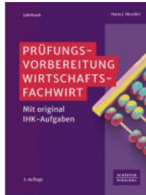
Prüfungsvorbereitung Wirtschaftsfachwirt Ladenpreis: 72,00EUR