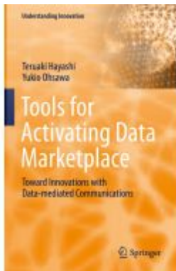
Tools for Activating Data Marketplace Ladenpreis: 164,99EUR