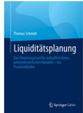
Liquiditätsplanung Ladenpreis: 41,11EUR