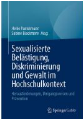
Sexualisierte Belästigung, Diskriminierung und Gewalt im Hochschulkontext Ladenpreis: 56,53EUR