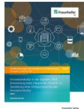
Innovationskultur in der digitalen Welt Ladenpreis: 90,50EUR