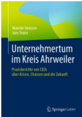
Unternehmertum im Kreis Ahrweiler Ladenpreis: 39,06EUR