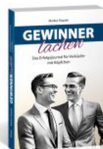
Gewinner lachen Ladenpreis: 24,70EUR