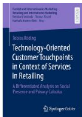
Technology-Oriented Customer Touchpoints in Context of Services in Retailing Ladenpreis: 93,49EUR