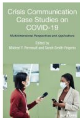
Crisis Communication Case Studies on COVID-19 Ladenpreis: 44,00EUR