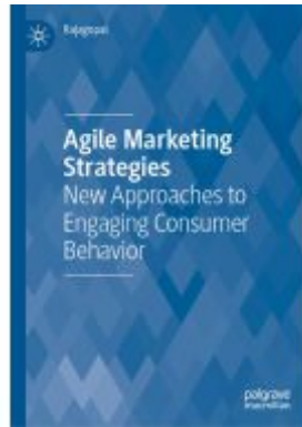
Agile Marketing Strategies Ladenpreis: 153,99EUR