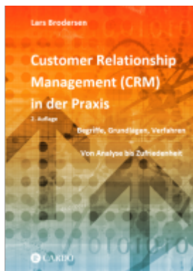
Customer Relationship Management (CRM) in der Praxis Ladenpreis: 29,90EUR