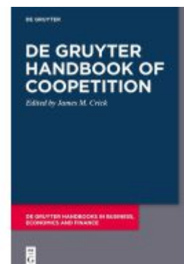
De Gruyter Handbook of Coopetition Ladenpreis: 139,95EUR