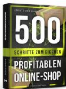
500 Schritte zum eigenen profitablen Online-Shop Ladenpreis: 19,90EUR