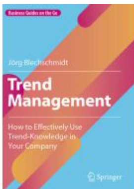
Trend Management Ladenpreis: 41,79EUR

Wir haben andere Produkte gefunden, die Ihnen gefallen könnten!