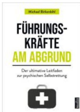
Führungskräfte am Abgrund Ladenpreis: 23,70EUR