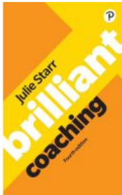
Brilliant Coaching 4e: Become a manager who can coach Ladenpreis: 21,39EUR