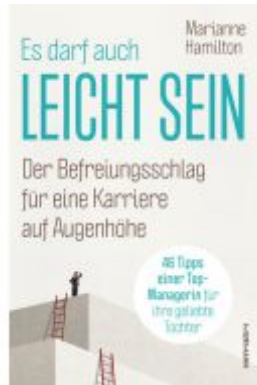
Es darf auch leicht sein Ladenpreis: 20,60EUR