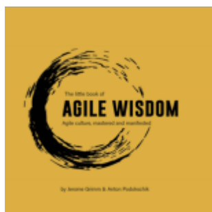
The Little Book of Agile Wisdom Ladenpreis: 19,99EUR