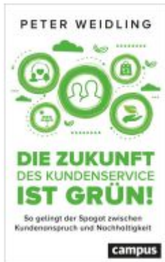
Die Zukunft des Kundenservice ist grün! Ladenpreis: 41,20EUR