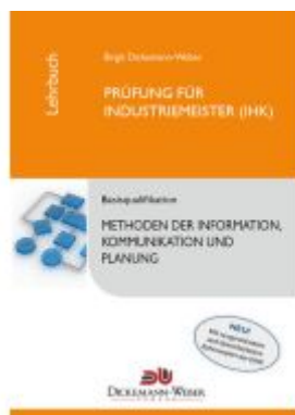
Industriemeister - Lehrbuch: Methoden der Information, Kommunikation und Planung - Tabellenbuch IKP Ladenpreis: 27,95EUR