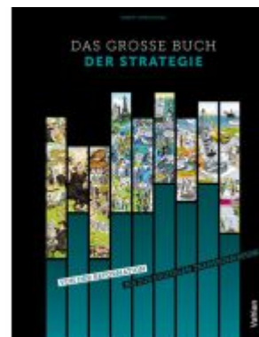
Das große Buch der Strategie Ladenpreis: 30,70EUR