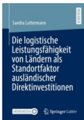
Die logistische Leistungsfähigkeit von Ländern als Standortfaktor ausländischer Direktinvestitionen Ladenpreis: 77,09EUR