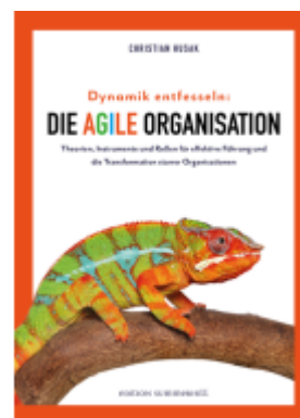
Dynamik entfesseln: Die agile Organisation Ladenpreis: 19,50EUR