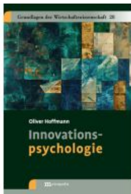
Innovationspsychologie Ladenpreis: 30,70EUR