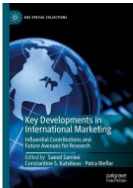
Key Developments in International Marketing Ladenpreis: 186,99EUR

Wir haben andere Produkte gefunden, die Ihnen gefallen könnten!