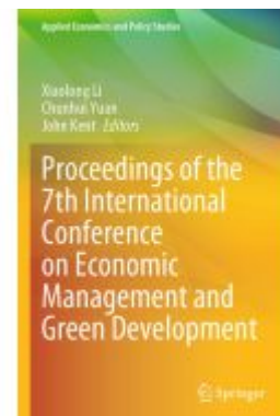
Proceedings of the 7th International Conference on Economic Management and Green Development Ladenpreis: 307,99EUR