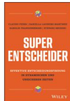
Super-Entscheider Ladenpreis: 41,20EUR