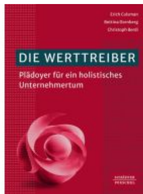
Die Werttreiber Ladenpreis: 30,90EUR