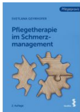
Pflegetherapie im Schmerzmanagement Ladenpreis: 24,90EUR