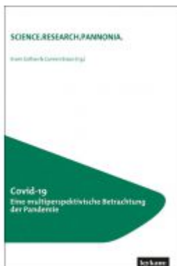
Covid-19 Eine multiperspektivische Betrachtung der Pandemie Ladenpreis: 35,00EUR