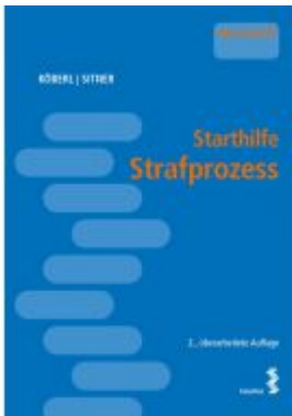
Starthilfe Strafprozess Ladenpreis: 24,00EUR