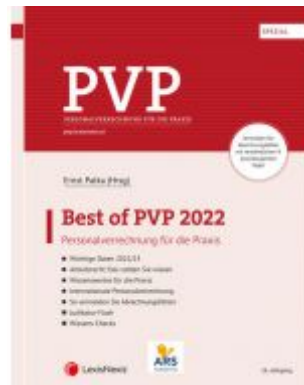
Best of PVP 2022 Ladenpreis: 64,00EUR