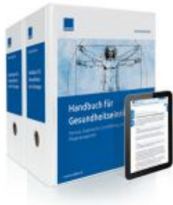
Handbuch für Gesundheitseinrichtungen Ladenpreis: 217,80EUR