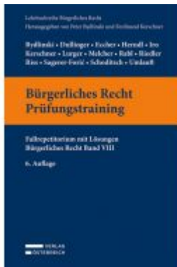
Bürgerliches Recht Prüfungstraining Ladenpreis: 39,00EUR