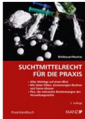
Suchtmittelrecht für die Praxis Ladenpreis: 32,00EUR