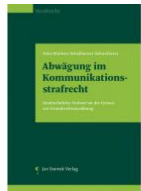
Abwägungen im Kommunikationsstrafrecht Ladenpreis: 148,00EUR