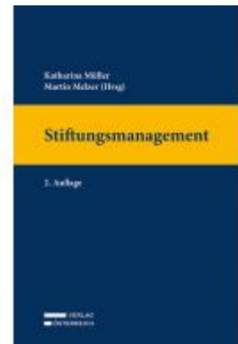
Stiftungsmanagement Ladenpreis: 149,00EUR