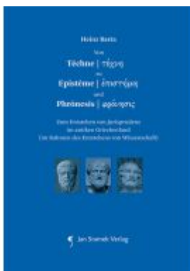
Von Técnica zu Epistème und Phrónesis Ladenpreis: 48,00EUR