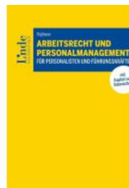
Arbeitsrecht und Personalmanagement für Personalisten und Führungskräfte Ladenpreis: 55,00EUR