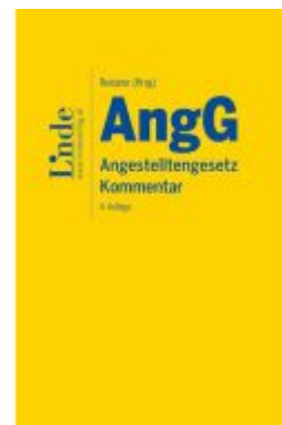
AngG | Angestelltengesetz Ladenpreis: 155,00EUR