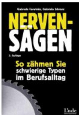
Nervensägen Ladenpreis: 22,00EUR