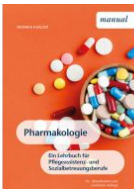
Pharmakologie Ladenpreis: 24,90EUR

Wir haben andere Produkte gefunden, die Ihnen gefallen könnten!