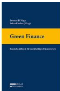
Green Finance Ladenpreis: 69,00EUR