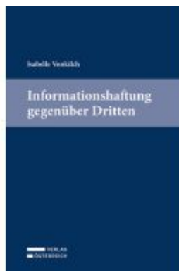
Informationshaftung gegenüber Dritten Ladenpreis: 79,00EUR