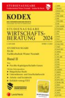
KODEX Wirtschaftsbearbeitung 2024 Band II - inkl. App Ladenpreis: 22,00EUR