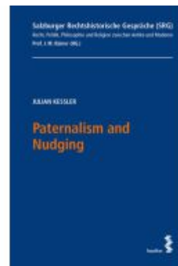
Paternalism and Nudging Ladenpreis: 22,00EUR