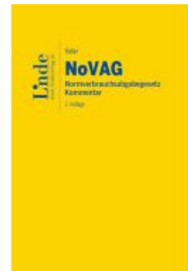
NoVAG | Normverbrauchsabgabengesetz Ladenpreis: 89,00EUR