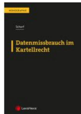
Datenmissbrauch im Kartellrecht Ladenpreis: 59,00EUR