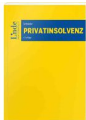
Privatinsolvenz Ladenpreis: 52,00EUR