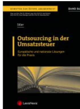
Outsourcing in der Umsatzsteuer Ladenpreis: 82,00EUR