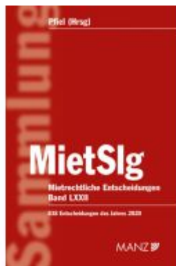
Mietrechtliche Entscheidungen MietSlg Ladenpreis: 229,00EUR