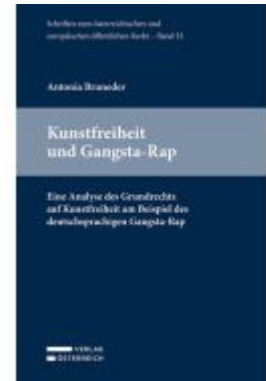
Kunstfreiheit und Gangsta-Rap Ladenpreis: 54,00EUR