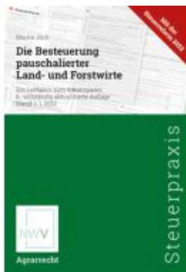
Die Besteuerung pauschalierter Land- und Forstwirte Ladenpreis: 128,00EUR