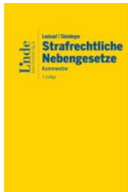
Leukauf/Steininger Strafrechtliche Nebengesetze Ladenpreis: 198,00EUR