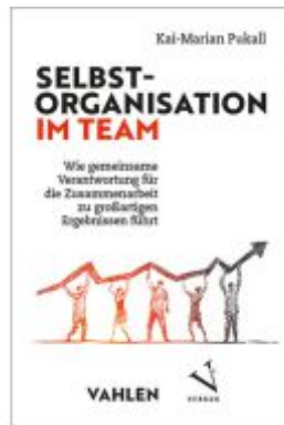
Selbstorganisation im Team