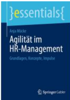
Agilität im HR-Management