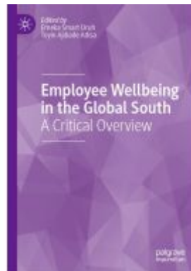
Employee Wellbeing in the Global South Ladenpreis: 186,99EUR