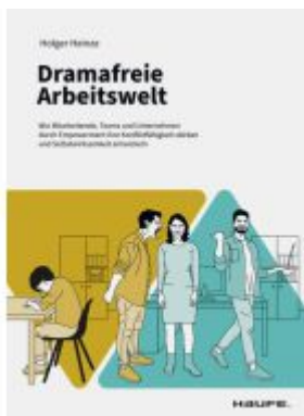
Dramafreie Arbeitswelt Ladenpreis: 30,90EUR