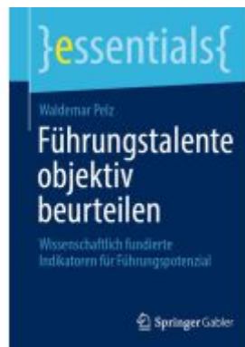
Führungstalente objektiv beurteilen Ladenpreis: 15,41EUR