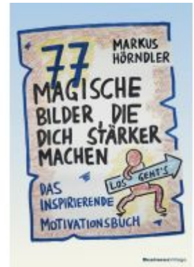
77 magische Bilder, die dich stärker machen