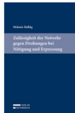
Zulässigkeit der Notwehr gegen Drohungen bei Nötigung und Erpressung Ladenpreis: 89,00EUR