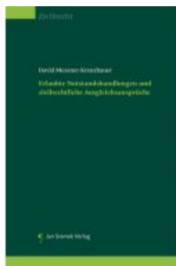
Erlaubte Notstandshandlungen und zivilrechtliche Ausgleichsansprüche Ladenpreis: 115,00EUR