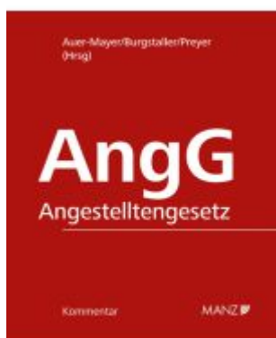
Kommentar zum Angestelltengesetz AngG Ladenpreis: 168,00EUR