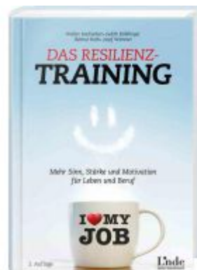
Das Resilienz-Training Ladenpreis: 26,90EUR