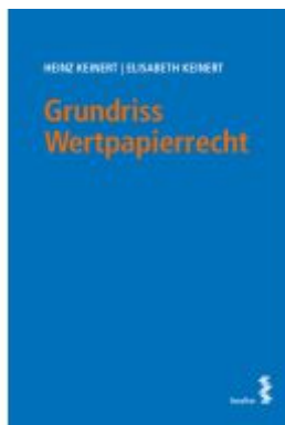
Grundriss Wertpapierrecht Ladenpreis: 26,00EUR