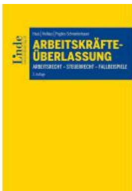
Arbeitskräfteüberlassung Ladenpreis: 42,00EUR