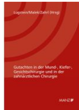
Gutachten in der Mund-, Kiefer-, Gesichtschirurgie und in der zahnärztlichen Chirurgie Ladenpreis: 58,00EUR