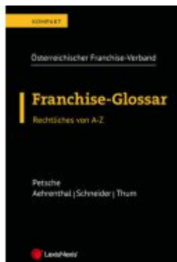
Franchise-Glossar Ladenpreis: 28,00EUR

Wir haben andere Produkte gefunden, die Ihnen gefallen könnten!