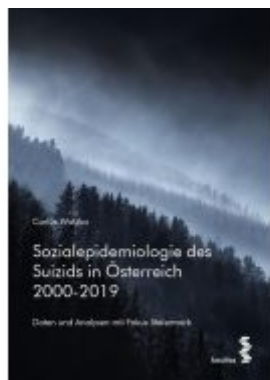
Sozialepidemiologie des Suizids in Österreich 2000-2019 Ladenpreis: 26,90EUR