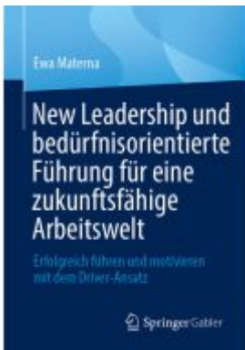
New Leadership und bedürfnisorientierte Führung für eine zukunftsfähige Arbeitswelt Ladenpreis: 46,25EUR