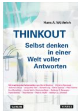
Thinkout Ladenpreis: 30,70EUR