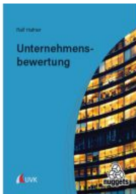
Unternehmensbewertung Ladenpreis: 20,50EUR