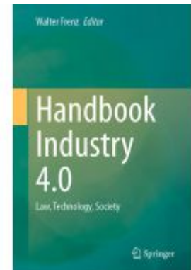
Handbook Industry 4.0 Ladenpreis: 329,99EUR