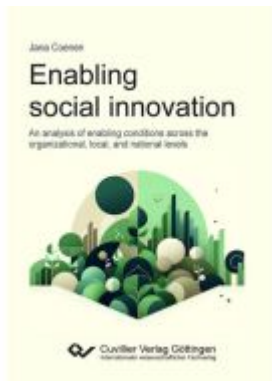
Enabling social innovation Ladenpreis: 61,60EUR

Wir haben andere Produkte gefunden, die Ihnen gefallen könnten!