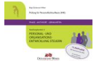
Personalfachkaufleute - Frage-Antwort-Karten Handlungsbereich 4: Personal- und Organisationsentwicklung steuern Ladenpreis: 33,95EUR