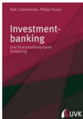
Investmentbanking Ladenpreis: 41,20EUR