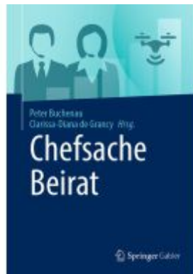
Chefsache Beirat Ladenpreis: 41,11EUR