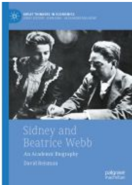
Sidney and Beatrice Webb Ladenpreis: 131,99EUR