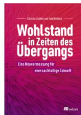
Wohlstand in Zeiten des Übergangs Ladenpreis: 37,10EUR