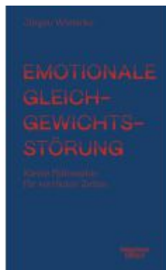
Emotionale Gleichgewichtsstörung Ladenpreis: 20,60EUR