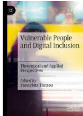
Vulnerable People and Digital Inclusion Ladenpreis: 142,99EUR