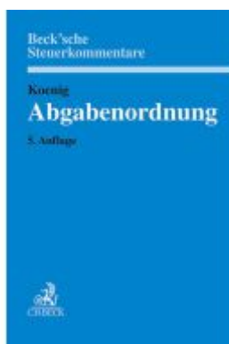
Abgabenordnung Ladenpreis: 225,20EUR