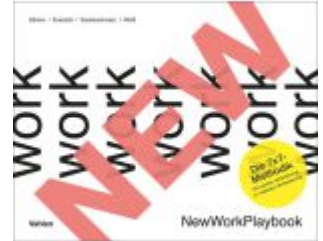
NewWorkPlaybook Ladenpreis: 30,70EUR