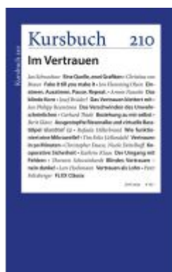
Kursbuch 210 Ladenpreis: 16,40EUR