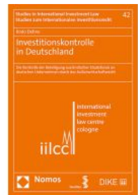
Investitionskontrolle in Deutschland Ladenpreis: 179,00EUR