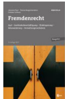
Fremdenrecht Ladenpreis: 39,00EUR