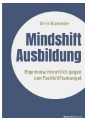
Mindshift Ausbildung Ladenpreis: 20,60EUR