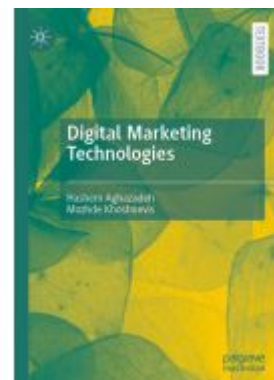
Digital Marketing Technologies Ladenpreis: 109,99EUR