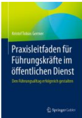
Praxisleitfaden für Führungskräfte im öffentlichen Dienst Ladenpreis: 41,11EUR