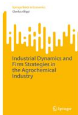
Industrial Dynamics and Firm Strategies in the Agrochemical Industry Ladenpreis: 54,99EUR