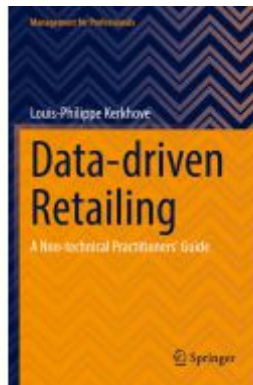
Data-driven Retailing Ladenpreis: 54,99EUR