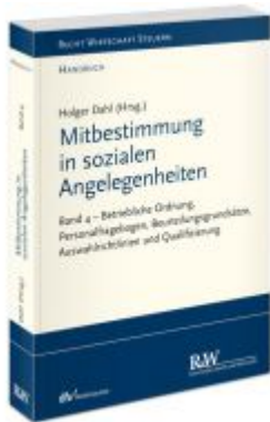
Mitbestimmung in sozialen Angelegenheiten, Band 4 Ladenpreis: 91,50EUR