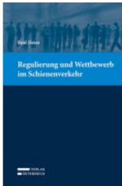
Regulierung und Wettbewerb im Schienenverkehr Ladenpreis: 74,00EUR