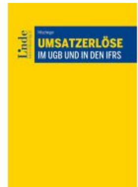
Umsatzerlöse im UGB und in den IFRS Ladenpreis: 78,00EUR