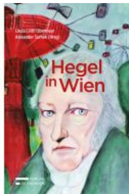
Hegel in Wien Ladenpreis: 55,00EUR