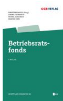
Betriebsratsfonds Ladenpreis: 36,00EUR