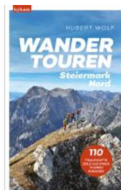
Wandertouren Steiermark Nord Ladenpreis: 28,00EUR