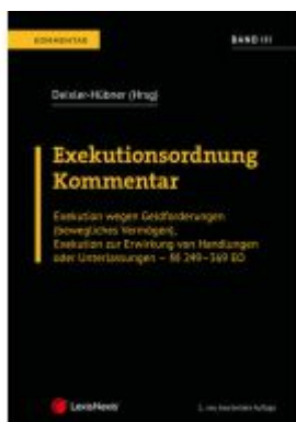
Exekutionsordnung - Kommentar Band 3 Ladenpreis: 195,00EUR