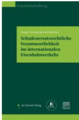
Schadenersatzrechtliche Verantwortlichkeit im internationalen Eisenbahnverkehr Ladenpreis: 44,90EUR