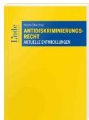
Antidiskriminierungsrecht Ladenpreis: 38,00EUR