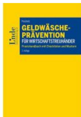
Geldwäscheprävention für Wirtschaftstreuhandler Ladenpreis: 34,00EUR