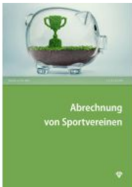
Abrechnung von Sportvereinen Ladenpreis: 27,50EUR

Wir haben andere Produkte gefunden, die Ihnen gefallen könnten!