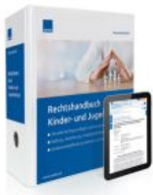
Rechtshandbuch Kinder- und Jugendschutz Ladenpreis: 239,80EUR