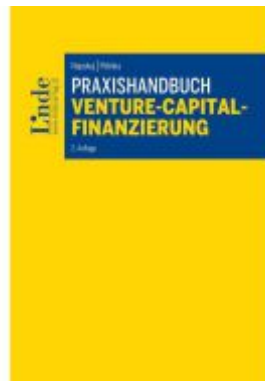
Praxishandbuch Venture-Capital- Finanzierung Ladenpreis: 59,00EUR