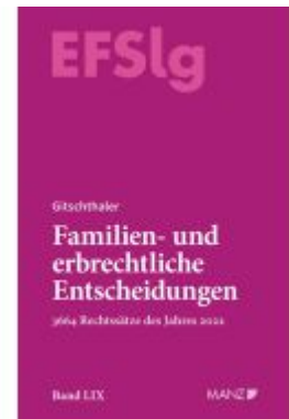
Familien- und erbrechtliche Entscheidungen EF-Slg Ladenpreis: 264,00EUR