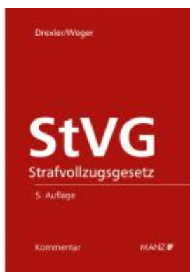
Strafvollzugsgesetz StVG Ladenpreis: 168,00EUR