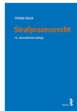
Strafprozessrecht Ladenpreis: 38,00EUR