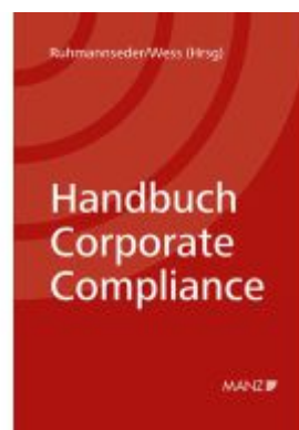
Handbuch Corporate Compliance Ladenpreis: 210,00EUR