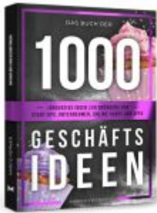
Das Buch der 1000 Geschäftsideen Ladenpreis: 19,90EUR