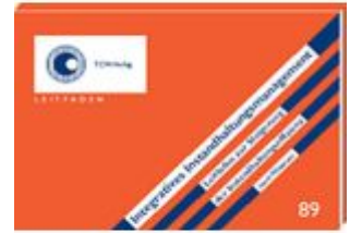
Integratives Instandhaltungsmanagement Ladenpreis: 257,10EUR