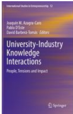
University-Industry Knowledge Interactions Ladenpreis: 120,99EUR