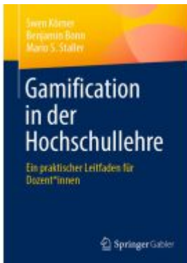
Gamification in der Hochschullehre Ladenpreis: 28,77EUR

Wir haben andere Produkte gefunden, die Ihnen gefallen könnten!