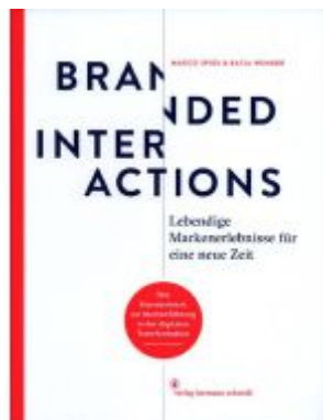
Branded Interactions Ladenpreis: 77,10EUR