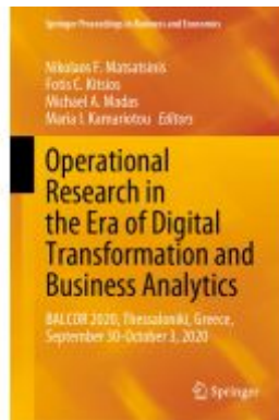
Operational Research in the Era of Digital Transformation and Business Analytics Ladenpreis: 241,99EUR