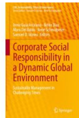
Corporate Social Responsibility in a Dynamic Global Environment Ladenpreis: 186,99EUR