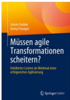
Müssen agile Transformationen scheitern? Ladenpreis: 39,06EUR