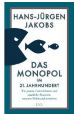
Das Monopol im 21. Jahrhundert Ladenpreis: 37,10EUR