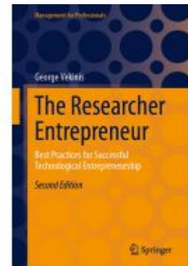
The Researcher Entrepreneur Ladenpreis: 49,49EUR