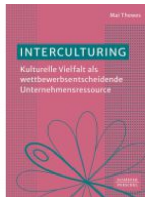
Interculturing Ladenpreis: 51,40EUR