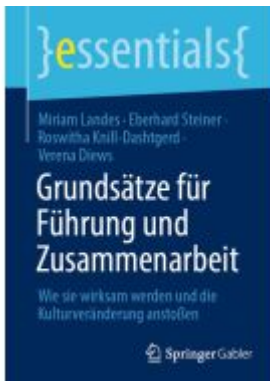
Grundsätze für Führung und Zusammenarbeit Ladenpreis: 15,41EUR

Wir haben andere Produkte gefunden, die Ihnen gefallen könnten!