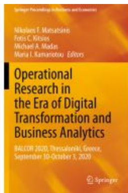
Operational Research in the Era of Digital Transformation and Business Analytics Ladenpreis: 241,99EUR