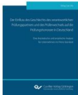
Der Einfluss des Geschlechts des verantwortlichen Prüfungspartners und des Prüferwechsels auf die Prüfungshonorare in Deutschland Ladenpreis: 98,60EUR