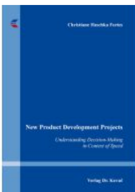
New Product Development Projects Ladenpreis: 87,20EUR