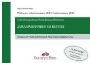
Industriemeister - Frage-Antwort-Karten: Zusammenarbeit im Betrieb ZIB Ladenpreis: 33,95EUR