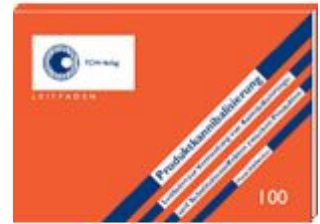
Produktkannibalisierung Ladenpreis: 257,10EUR