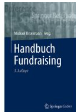
Handbuch Fundraising Ladenpreis: 133,63EUR