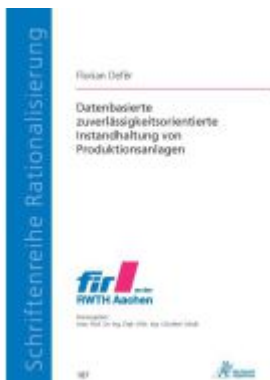
Datenbasierte zuverlässigkeitsorientierte Instandhaltung von Produktionsanlagen Ladenpreis: 50,40EUR