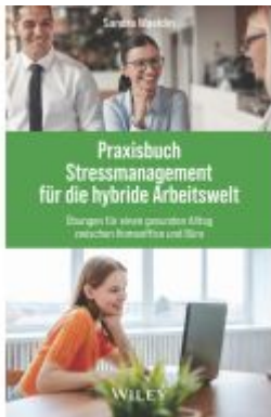
Praxisbuch Stressmanagement für die hybride Arbeitswelt Ladenpreis: 20,60EUR