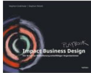
Impact Business Design Ladenpreis: 35,90EUR