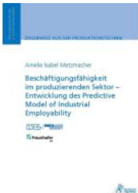
Beschäftigungsfähigkeit im produzierenden Sektor – Entwicklung des Predictive Model of Industrial Employability Ladenpreis: 50,40EUR

Wir haben andere Produkte gefunden, die Ihnen gefallen könnten!