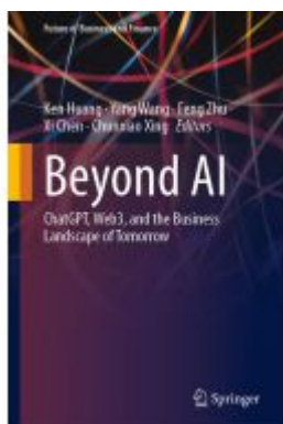
Beyond AI Ladenpreis: 98,99EUR