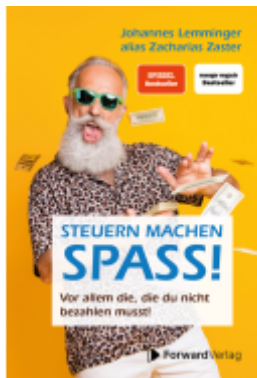
Steuern machen Spaß Ladenpreis: 24,90EUR