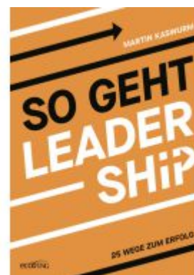
So geht Leadership Ladenpreis: 26,00EUR