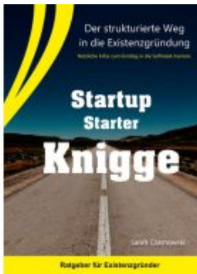
Startup Starter Knigge Ladenpreis: 9,20EUR