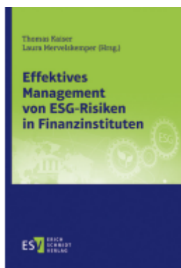
Effektives Management von ESG-Risiken in Finanzinstituten Ladenpreis: 51,40EUR