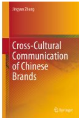
Cross-Cultural Communication of Chinese Brands Ladenpreis: 164,99EUR