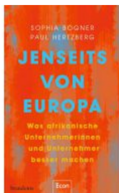
Jenseits von Europa Ladenpreis: 25,70EUR