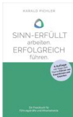
Sinn-erfüllt arbeiten. Erfolgreich führen. Ladenpreis: 14,40EUR