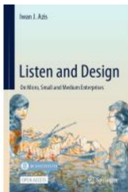
Listen and Design Ladenpreis: 54,99EUR