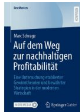
Auf dem Weg zur nachhaltigen Profitabilität Ladenpreis: 71,95EUR