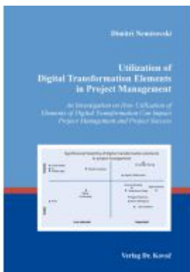
Utilization of Digital Transformation Elements in Project Management Ladenpreis: 102,60EUR