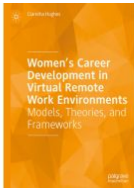
Women's Career Development in Virtual Remote Work Environments