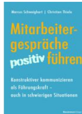
Mitarbeitergespräche positiv führen