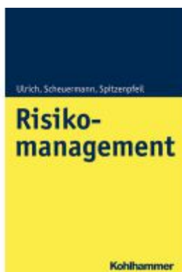
Risikomanagement Ladenpreis: 30,90EUR