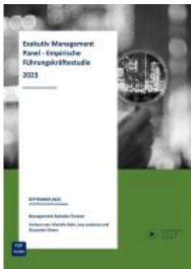
EXEKUTIV MANAGEMENT PANEL - EMPIRISCHE FÜHRUNGSKRÄFTESTUDIE 2023

Wir haben andere Produkte gefunden, die Ihnen gefallen könnten!