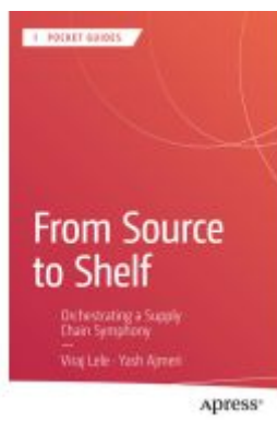
From Source to Shelf