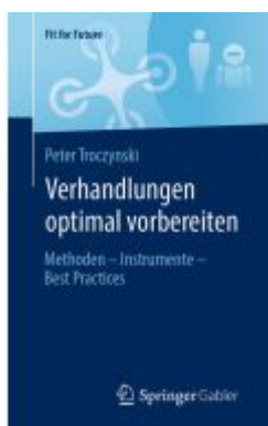
Verhandlungen optimal vorbereiten Ladenpreis: 20,55EUR