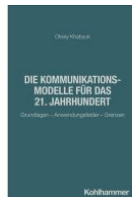
49 Kommunikationsmodelle für das 21. Jahrhundert