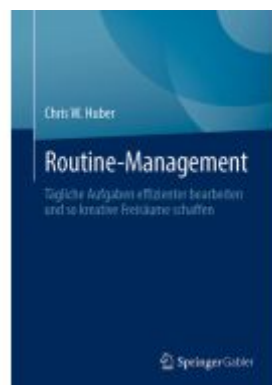
Routine-Management Ladenpreis: 35,97EUR