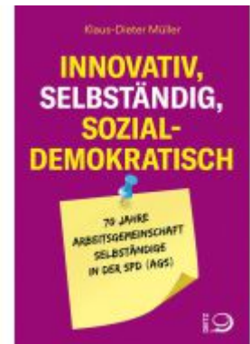
Innovativ, selbständig, sozialdemokratisch Ladenpreis: 18,50EUR