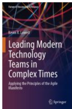
Leading Modern Technology Teams in Complex Times Ladenpreis: 65,99EUR