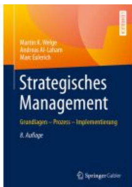
Strategisches Management Ladenpreis: 92,51EUR