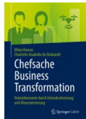
Chefsache Business Transformation Ladenpreis: 41,11EUR