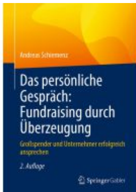
Das persönliche Gespräch: Fundraising durch Überzeugung Ladenpreis: 56,53EUR

Wir haben andere Produkte gefunden, die Ihnen gefallen könnten!