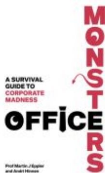
Office Monsters: A survival guide to corporate madness Ladenpreis: 16,04EUR