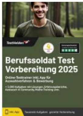
Berufssoldat Test Vorbereitung 2025: Online-Testtrainer inkl. App für Auswahlverfahren & Bewerbung + 5.000 Aufgaben mit Lösungen, Erfahrungsberichte, Austausch in Community, Mathe-Training uvm. Ladenpreis: 41,10EUR