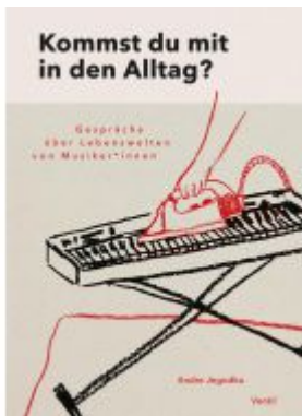
Kommst du mit in den Alltag? Ladenpreis: 18,50EUR