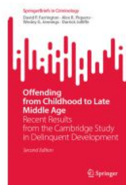
Offending from Childhood to Late Middle Age Ladenpreis: 60,49EUR