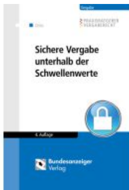
Sichere Vergabe unterhalb der Schwellenwerte Ladenpreis: 60,70EUR