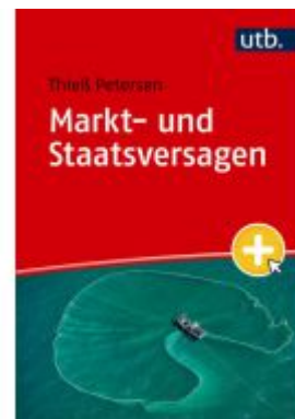
Markt- und Staatsversagen Ladenpreis: 23,60EUR