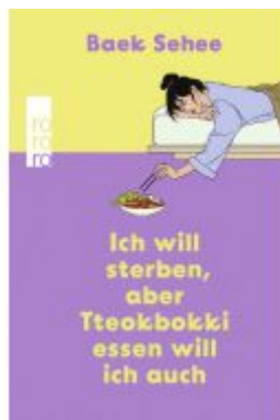
Ich will sterben, aber Tteokbokki essen will ich auch Ladenpreis: 20,60EUR