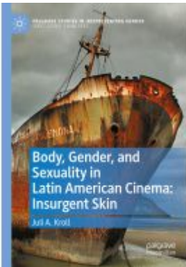
Body, Gender, and Sexuality in Latin American Cinema: Insurgent Skin Ladenpreis: 93,49EUR