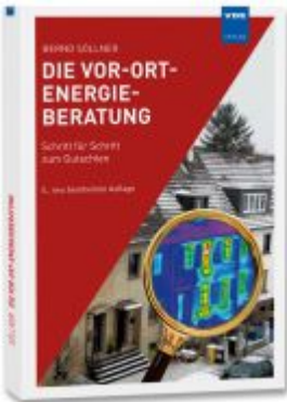
Die Vor-Ort-Energieberatung Ladenpreis: 30,00EUR