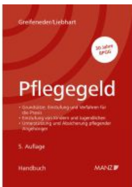
Pflegegeld Ladenpreis: 118,00EUR