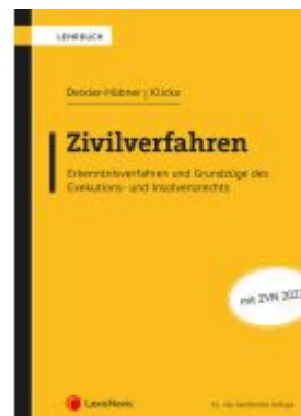
Zivilverfahren Ladenpreis: 69,00EUR