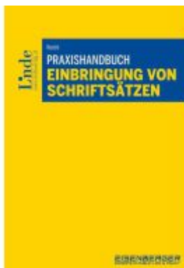
Praxishandbuch Einbringung von Schriftsätzen Ladenpreis: 79,00EUR