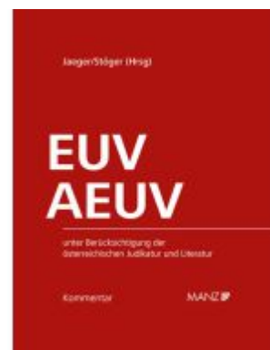
Kommentar zu EUV und AEUV Ladenpreis: 398,00EUR