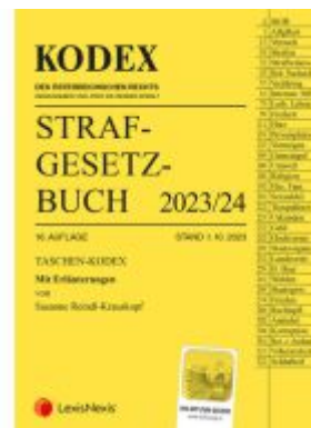
Taschen-Kodex Strafrechtsgesetzbuch 2023 - inkl. App Ladenpreis: 16,50EUR