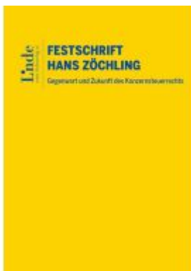
Gegenwart und Zukunft des Konzernsteuerrechts – Festschrift für Hans Zöchling Ladenpreis: 138,00EUR