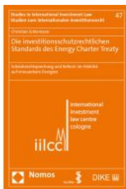
Die investitionsschutzrechtlichen Standards des Energy Charter Treaty Ladenpreis: 132,70EUR