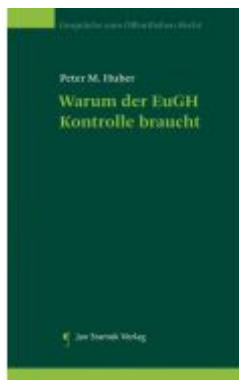
Warum der EuGH Kontrolle braucht Ladenpreis: 24,90EUR