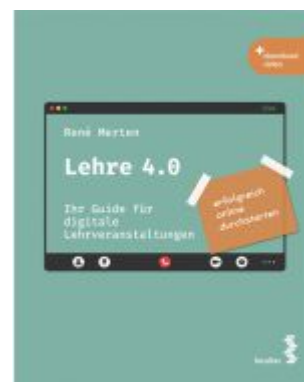
Lehre 4.0 Ladenpreis: 21,90EUR