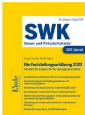
SWK-Spezial Die Feststellungserklärung 2022 Ladenpreis: 49,00EUR

Wir haben andere Produkte gefunden, die Ihnen gefallen könnten!