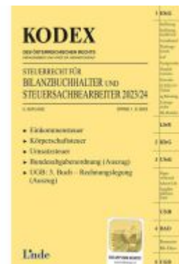
KODEX Steuerrecht für Bilanzbuchhalter und Steuersachbearbeiter 2023/24 Ladenpreis: 55,00EUR