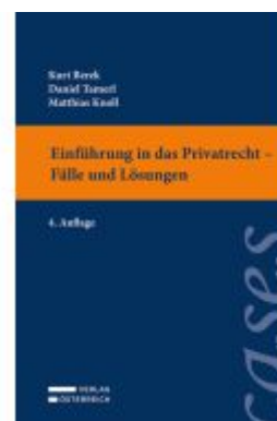
Einführung in das Privatrecht - Fälle und Lösungen Ladenpreis: 29,00EUR