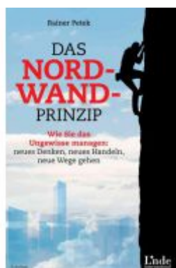
Das Nordwand-Prinzip Ladenpreis: 29,90EUR