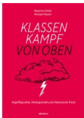
Klassenkampf von oben Ladenpreis: 29,90EUR