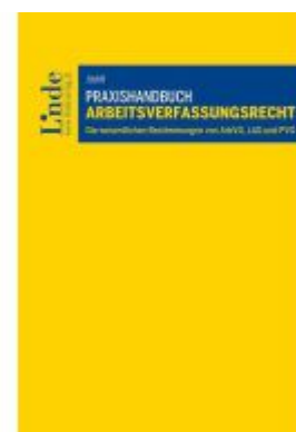
Praxishandbuch Arbeitsverfassungsrecht Ladenpreis: 79,00EUR