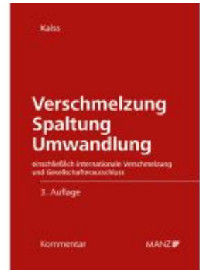
Verschmelzung Spaltung Umwandlung Ladenpreis: 298,00EUR