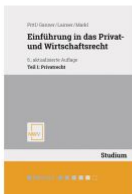
Einführung in das Privat- und Wirtschaftsrecht Ladenpreis: 44,00EUR