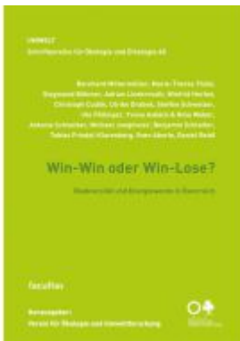
Win-Win oder Win-Lose? Ladenpreis: 19,90EUR