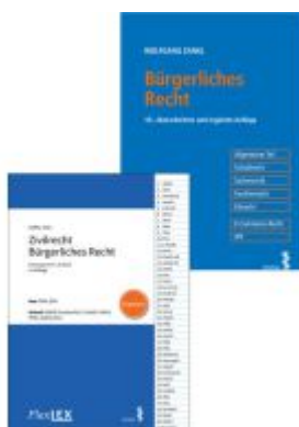
Kombipaket Bürgerliches Recht und FlexLex Zivilrecht/Bürgerliches Recht | Studium Ladenpreis: 68,00EUR