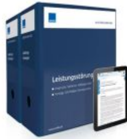
Mustersammlung Leistungsstörungen Ladenpreis: 261,80EUR