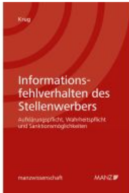
Informationsfehlverhalten des Stellenwerbers Ladenpreis: 76,00EUR

Wir haben andere Produkte gefunden, die Ihnen gefallen könnten!