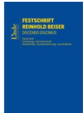
Festschrift Reinhold Beiser Ladenpreis: 160,00EUR