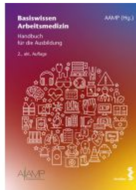
Basiswissen Arbeitsmedizin Ladenpreis: 94,00EUR