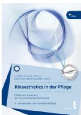
Kinaesthetics in der Pflege Ladenpreis: 32,90EUR