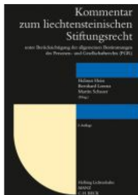
Kommentar zum liechtensteinischen Stiftungsrecht Ladenpreis: 348,00EUR