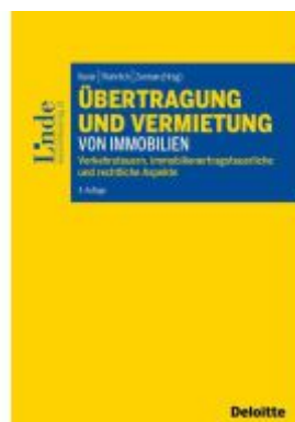
Übertragung und Vermietung von Immobilien Ladenpreis: 64,00EUR