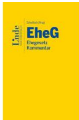
EheG | Ehegesetz Ladenpreis: 159,00EUR