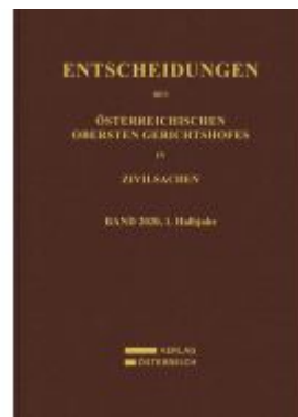
Entscheidungen des Obersten Gerichtshofes in Zivilsachen Ladenpreis: 186,00EUR