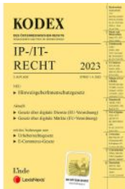
KODEX IP-/IT-Recht 2023 - inkl. App Ladenpreis: 69,00EUR