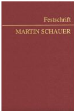
Festschrift Martin Schauer Ladenpreis: 178,00EUR