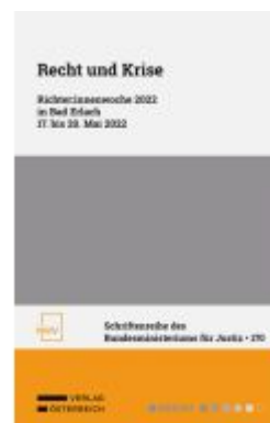
Recht und Krise Ladenpreis: 48,00EUR