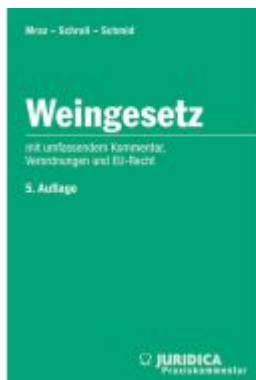
Weingesetz 5.Auflage Ladenpreis: 150,00EUR

Wir haben andere Produkte gefunden, die Ihnen gefallen könnten!