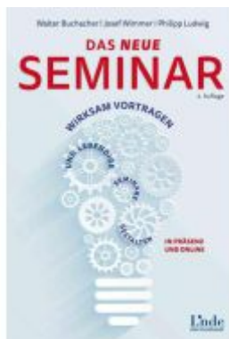
Das neue Seminar Ladenpreis: 29,90EUR