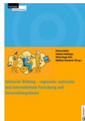
Inklusive Bildung - regionale, nationale und internationale Forschung und Entwicklungslinien Ladenpreis: 31,00EUR