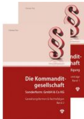
Die Kommanditgesellschaft Set: Band 1 +2 Ladenpreis: 109,00EUR