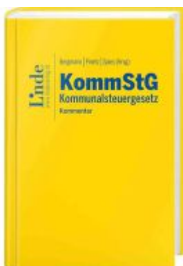
KommStG | Kommunalsteuergesetz Aktionspreis: 120,00EUR Ladenpreis: 150,00EUR