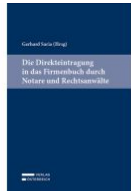
Die Direkteintragung in das Firmenbuch durch Notare und Rechtsanwälte Ladenpreis: 39,00EUR