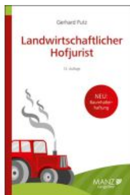
Landwirtschaftlicher Hofjurist Ladenpreis: 26,80EUR