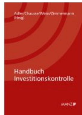
Handbuch Investitionskontrolle Ladenpreis: 112,00EUR