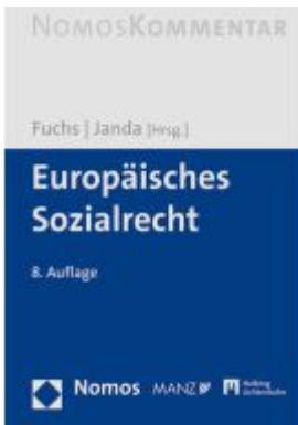
Europäisches Sozialrecht Ladenpreis: 162,40EUR