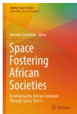
Space Fostering African Societies Ladenpreis: 175,99EUR