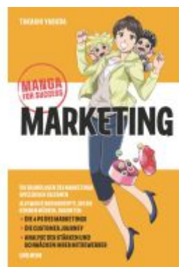
Manga for Success - Marketing Ladenpreis: 22,70EUR