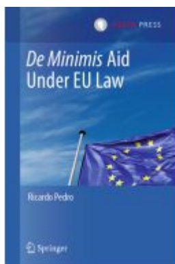
De Minimis Aid Under EU Law Ladenpreis: 109,99EUR