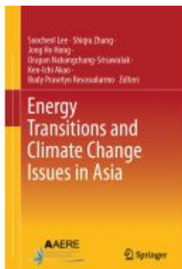
Energy Transitions and Climate Change Issues in Asia Ladenpreis: 175,99EUR

Wir haben andere Produkte gefunden, die Ihnen gefallen könnten!