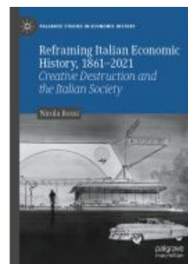
Reframing Italian Economic History, 1861–2021 Ladenpreis: 142,99EUR