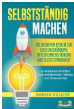
SELBSTSTÄNDIG MACHEN: Die goldenen Regeln zur Existenzgründung, Unternehmensführung und Selbstständigkeit - In einfachen Schritten zum erfolgreichen Startup und Unternehmer Ladenpreis: 16,40EUR