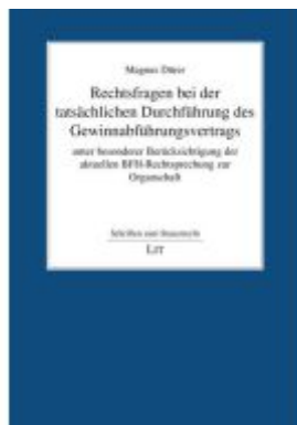
Rechtsfragen bei der tatsächlichen Durchführung des Gewinnabführungsvertrags unter besonderer Berücksichtigung der aktuellen BFH-Rechtsprechung zur Organschaft Ladenpreis: 19,90EUR