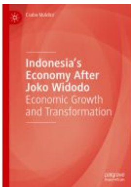
Indonesia's Economy After Joko Widodo Ladenpreis: 142,99EUR