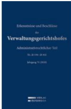
Erkenntnisse und Beschlüsse des Verwaltungsgerichtshofes Ladenpreis: 392,00EUR