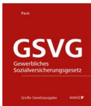
Die Sozialversicherung der in der gewerblichen Wirtschaft selbständig Erwerbstätigen - GSVG Ladenpreis: 298,00EUR