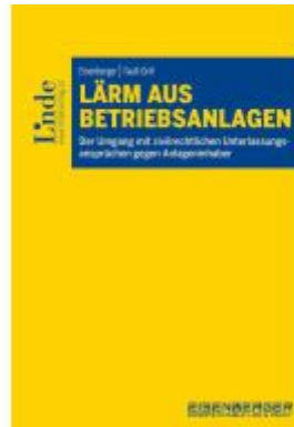
Lärm aus Betriebsanlagen Ladenpreis: 39,00EUR