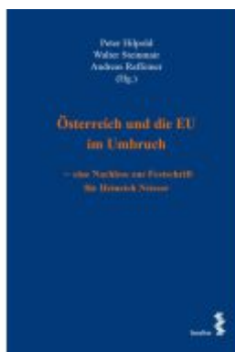
Österreich und die EU im Umbruch – eine Nachlese zur Festschrift für Heinrich Neisser Ladenpreis: 86,00EUR