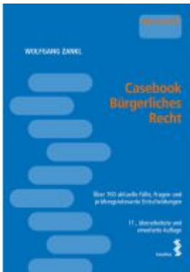
Casebook Bürgerliches Recht Ladenpreis: 48,00EUR