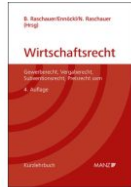
Grundriss des österreichischen Wirtschaftsrechts Ladenpreis: 93,00EUR