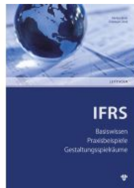
IFRS – International Financial Reporting Standards Ladenpreis: 24,20EUR