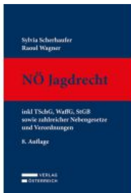
Nö Jagdrecht Ladenpreis: 189,00EUR

Wir haben andere Produkte gefunden, die Ihnen gefallen könnten!