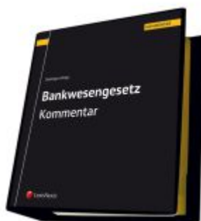
Bankwesengesetz - BWG Kommentar Ladenpreis: 698,00EUR

Wir haben andere Produkte gefunden, die Ihnen gefallen könnten!