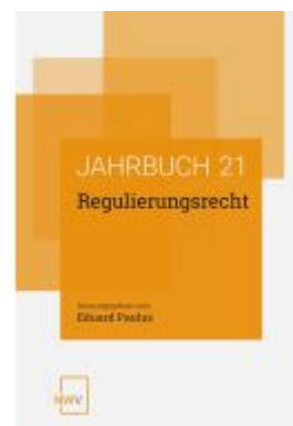
Regulierungsrecht Ladenpreis: 68,00EUR