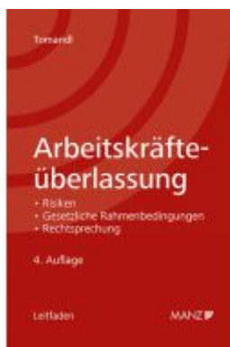
Arbeitskräfteüberlassung Ladenpreis: 46,00EUR