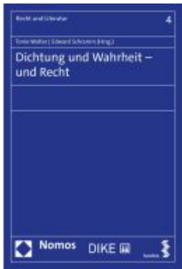
Dichtung und Wahrheit □ und Recht Ladenpreis: 53,50EUR