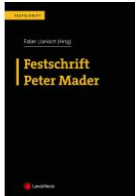
Festschrift Peter Mader Ladenpreis: 114,00EUR