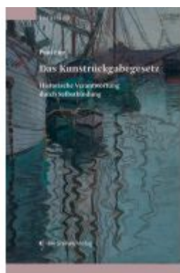
Das Kunststückgabegesetz Ladenpreis: 78,00EUR