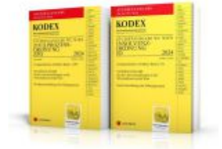
KODEX ZPO - IO für die WU 2024 - inkl. App Ladenpreis: 26,00EUR