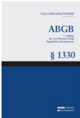
Großkommentar zum ABGB - Klang Kommentar Ladenpreis: 200,00EUR