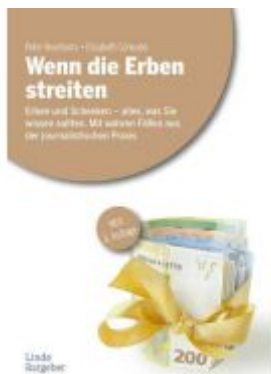
Wenn die Erben streiten Ladenpreis: 24,90EUR