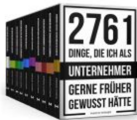
2761 Dinge, die ich als Unternehmer gerne früher gewusst hätte Ladenpreis: 204,60EUR