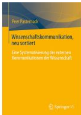
Wissenschaftskommunikation, neu sortiert Ladenpreis: 71,95EUR