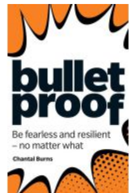
Bulletproof: Be fearless and resilient, no matter what Ladenpreis: 16,04EUR