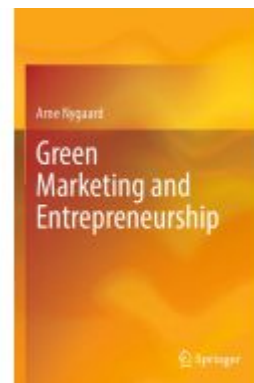
Green Marketing and Entrepreneurship Ladenpreis: 93,49EUR