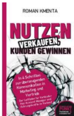
Nutzen verkaufen, Kunden gewinnen Ladenpreis: 15,98EUR

Wir haben andere Produkte gefunden, die Ihnen gefallen könnten!