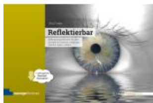
Reflektierbar Ladenpreis: 51,30EUR