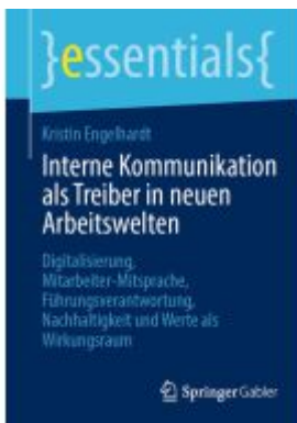
Interne Kommunikation als Treiber in neuen Arbeitswelten Ladenpreis: 15,41EUR