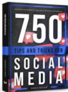
750 Tips and Tricks for Social Media Ladenpreis: 19,90EUR