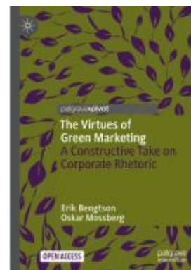
The Virtues of Green Marketing Ladenpreis: 43,99EUR