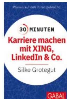
30 Minuten Karriere machen mit XING, LinkedIn und Co. Ladenpreis: 11,30EUR