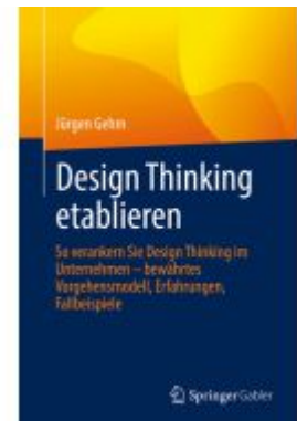
Design Thinking etablieren Ladenpreis: 77,09EUR