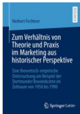
Zum Verhältnis von Theorie und Praxis im Marketing aus historischer Perspektive Ladenpreis: 102,79EUR