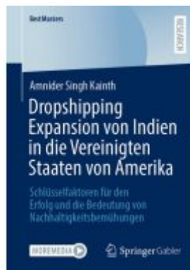
Dropshipping Expansion von Indien in die Vereinigten Staaten von Amerika Ladenpreis: 66,81EUR