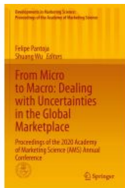
From Micro to Macro: Dealing with Uncertainties in the Global Marketplace Ladenpreis: 241,99EUR