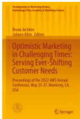
Optimistic Marketing in Challenging Times: Serving Ever-Shifting Customer Needs Ladenpreis: 241,99EUR