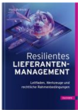
Resilientes Lieferantenmanagement Ladenpreis: 72,00EUR