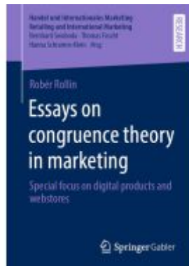
Essays on congruence theory in marketing Ladenpreis: 54,99EUR