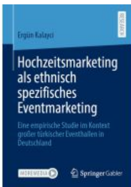
Hochzeitsmarketing als ethnisch spezifisches Eventmarketing Ladenpreis: 71,95EUR