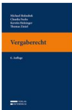
Vergaberecht Ladenpreis: 36,00EUR