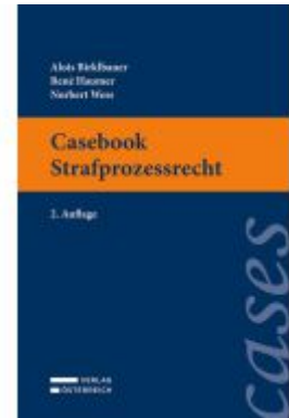
Casebook Strafprozessrecht Ladenpreis: 32,00EUR