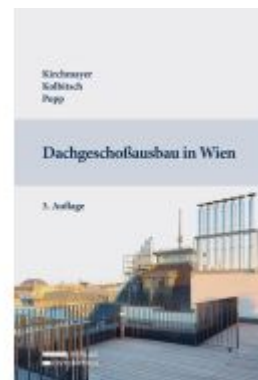
Dachgeschoßausbau in Wien Ladenpreis: 79,00EUR