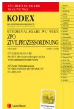
KODEX ZPO für die WU 2023/24 - inkl. App Ladenpreis: 21,00EUR

Wir haben andere Produkte gefunden, die Ihnen gefallen könnten!