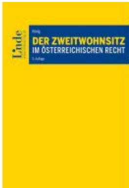
Der Zweitwohnsitz im österreichischen Recht Ladenpreis: 42,00EUR