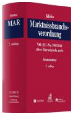
Marktmisbrauchsverordnung Ladenpreis: 189,00EUR