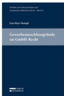
Gewerbeausschlussgründe im GmbH- Recht Ladenpreis: 84,00EUR