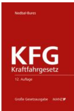
Kraftfahrsgesetz - KFG Ladenpreis: 138,00EUR