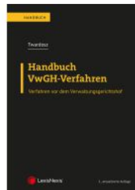
Handbuch VwGH-Verfahren Ladenpreis: 69,00EUR