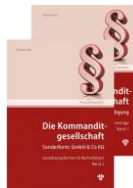
Die Kommanditgesellschaft Set: Band 1 +2 Ladenpreis: 109,00EUR