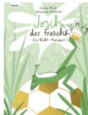
Josch der Froschkönig – Ein Nicht-Märchen Ladenpreis: 18,50EUR