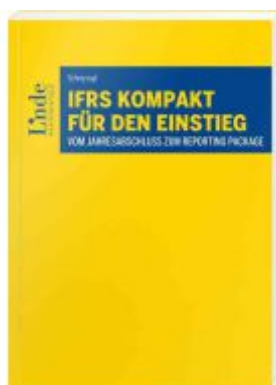
IFRS kompakt für den Einstieg Ladenpreis: 28,00EUR