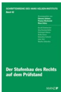
Der Stufenbau des Rechts auf dem Prüfstand Ladenpreis: 38,00EUR