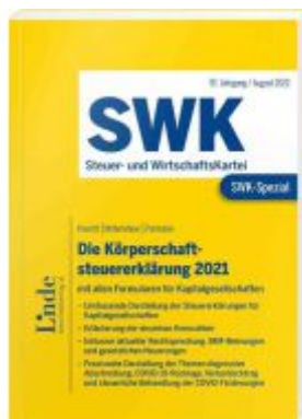
SWK-Spezial Die Körperschaftsteuererklärung 2021 Ladenpreis: 48,00EUR