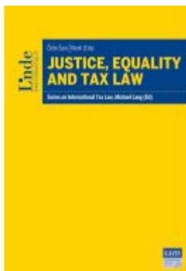
Justice, Equality and Tax Law Ladenpreis: 145,00EUR