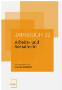
Arbeits- und Sozialrecht Ladenpreis: 64,00EUR

Wir haben andere Produkte gefunden, die Ihnen gefallen könnten!