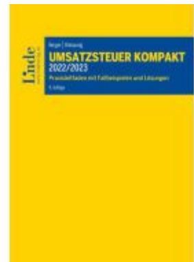
Umsatzsteuer kompakt 2022/2023 Ladenpreis: 62,00EUR