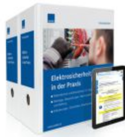
Elektrosicherheit in der Praxis Ladenpreis: 273,90EUR