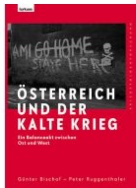
Österreich und der Kalte Krieg Ladenpreis: 39,00EUR