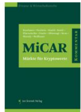
Kommentar zur MiCAR Ladenpreis: 248,00EUR