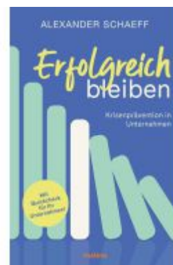
Erfolgreich bleiben Ladenpreis: 22,70EUR