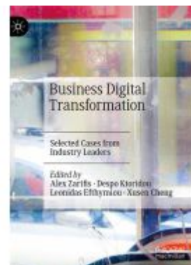
Business Digital Transformation Ladenpreis: 175,99EUR