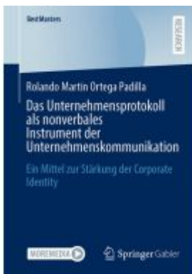
Das Unternehmensprotokoll als nonverbales Instrument der Unternehmenskommunikation Ladenpreis: 71,95EUR