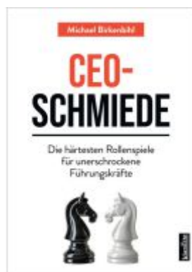
CEO-Schmiede Ladenpreis: 19,60EUR