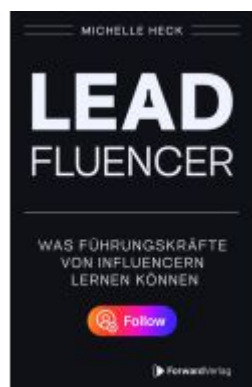
Leadfluencer Ladenpreis: 20,00EUR