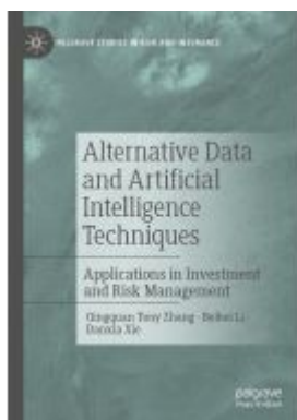
Alternative Data and Artificial Intelligence Techniques Ladenpreis: 164,99EUR