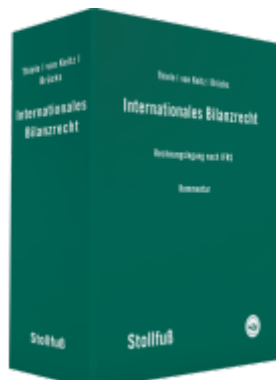
Internationales Bilanzrecht Kommentar Ladenpreis: 949,30EUR