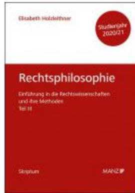
Rechtsphilosophie und Rechtsethik Einführung in die Rechtswissenschaften und ihre Methoden: Teil III Ladenpreis: 14,00 EUR