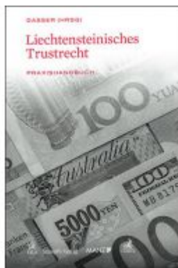
Liechtensteinisches Trustrecht Ladenpreis: 99,00 EUR