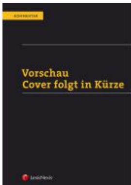
Kommentar zum Umweltrecht Band 2 Ladenpreis: 89,00 EUR

Wir haben andere Produkte gefunden, die Ihnen gefallen könnten!