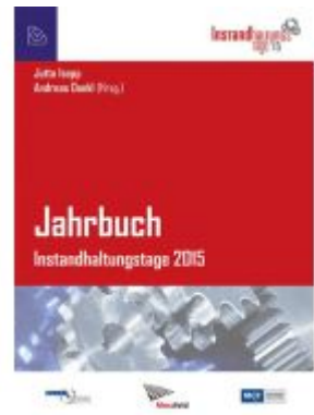
Jahrbuch Instandhaltungstage 2015 Ladenpreis: 54,90 EUR