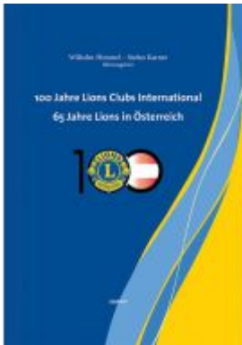
100 Jahre Lions Clubs International. 65 Jahre Lions in Österreich Ladenpreis: 29,90 EUR