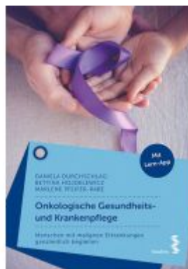
Onkologische Gesundheits- und Krankenpflege Ladenpreis: 24,90 EUR