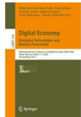
Digital Economy. Emerging Technologies and Business Innovation Ladenpreis: 142,99EUR