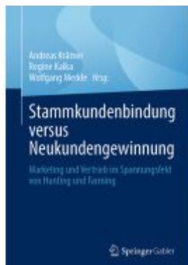
Stammkundenbindung versus Neukundengewinnung Ladenpreis: 61,67EUR