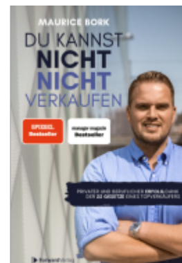
Du kannst nicht nicht verkaufen Ladenpreis: 24,90EUR