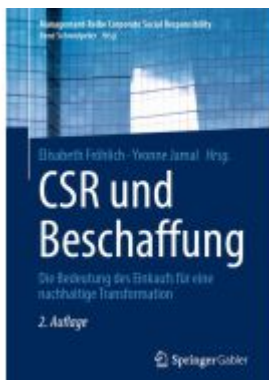
CSR und Beschaffung Ladenpreis: 56,53EUR

Wir haben andere Produkte gefunden, die Ihnen gefallen könnten!