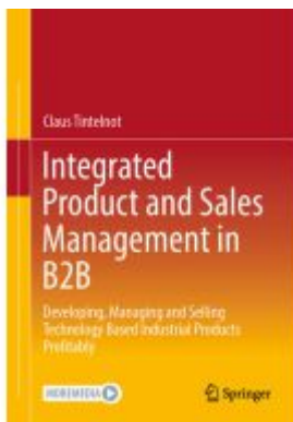
Integrated Product and Sales Management in B2B Ladenpreis: 76,99EUR