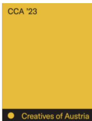
Creativ Club Austria-Annual 23 Ladenpreis: 39,90EUR