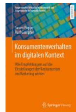
Konsumentenverhalten im digitalen Kontext Ladenpreis: 35,97EUR