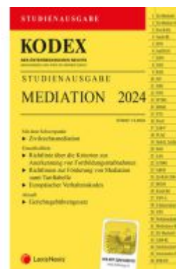
KODEX Mediation Studienausgabe Ladenpreis: 15,00EUR