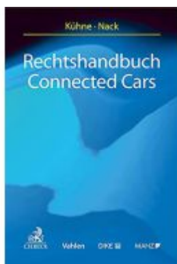
Rechtshandbuch Connected Cars Ladenpreis: 89,00EUR