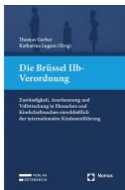
Die Brüssel IIb-Verordnung Ladenpreis: 149,00EUR