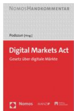
Digital Markets Act Ladenpreis: 134,00EUR