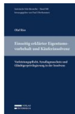
Einseitig erklärter Eigentumsverbehalt und Käuferinsolvenz... Ladenpreis: 107,10EUR