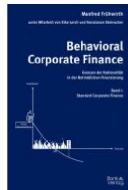
Behavioral Corporate Finance - Grenzen der Rationalität in der Betrieblichen Finanzierung Ladenpreis: 47,00EUR