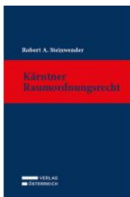
Kärntner Raumordnungsrecht Ladenpreis: 166,00EUR