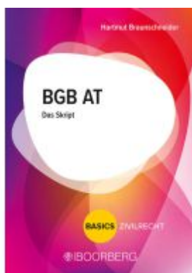
BGB AT Ladenpreis: 22,50EUR