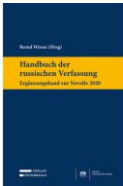
Handbuch der russischen Verfassung - Ergänzungsband zur Novelle 2020 Ladenpreis: 149,00EUR