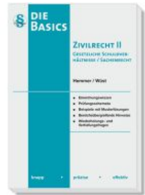
Basics Zivilrecht II Gesetzliche Schuldverhältnisse / Sachenrecht Ladenpreis: 19,40EUR