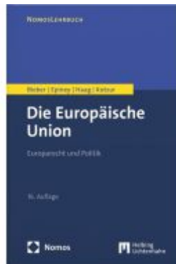
Die Europäische Union Ladenpreis: 53,00EUR