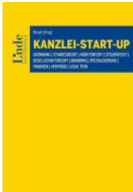
Kanzlei-Start-up Ladenpreis: 46,00EUR

Wir haben andere Produkte gefunden, die Ihnen gefallen könnten!