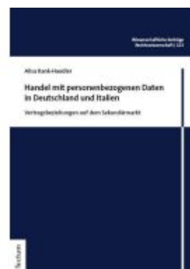
Handel mit personenbezogenen Daten in Deutschland und Italien Ladenpreis: 81,30EUR