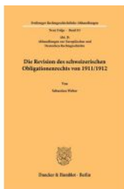
Die Revision des schweizerischen Obligationenrechts von 1911-1912. Ladenpreis: 71,90EUR