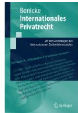
Internationales Privatrecht Ladenpreis: 25,65EUR