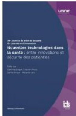
Nouvelles technologies dans la santé : entre innovations et sécurité des patient- es Ladenpreis: 55,00EUR