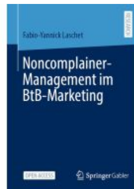
Noncomplainer-Management im BtB- Marketing Ladenpreis: 43,99EUR