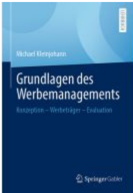
Grundlagen des Werbemanagements Ladenpreis: 71,95EUR