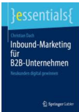
Inbound-Marketing für B2B-Unternehmen Ladenpreis: 15,41EUR