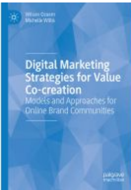
Digital Marketing Strategies for Value Co-creation Ladenpreis: 120,99EUR