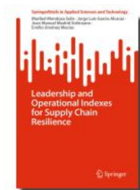
Leadership and Operational Indexes for Supply Chain Resilience Ladenpreis: 54,99EUR