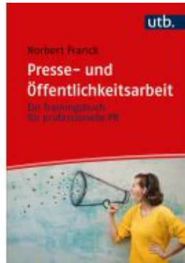
Presse- und Öffentlichkeitsarbeit Ladenpreis: 20,60EUR