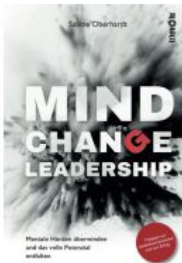
MIND CHANGE LEADERSHIP® Ladenpreis: 18,70EUR

Wir haben andere Produkte gefunden, die Ihnen gefallen könnten!