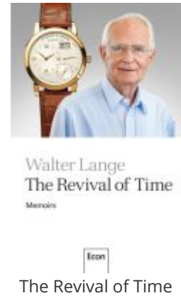
The Revival of Time Ladenpreis: 28,80EUR