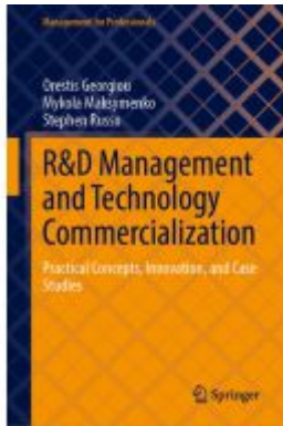
R&D Management and Technology Commercialization Ladenpreis: 109,99EUR