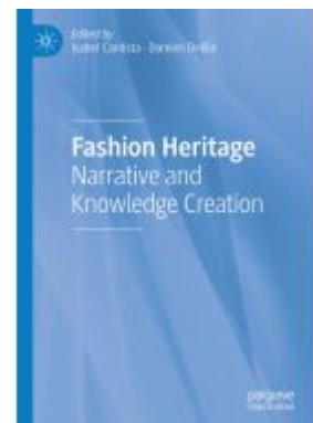
Fashion Heritage Ladenpreis: 197,99EUR