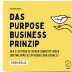
Das Purpose Business Prinzip Ladenpreis: 22,70EUR