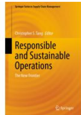
Responsible and Sustainable Operations Ladenpreis: 197,99EUR