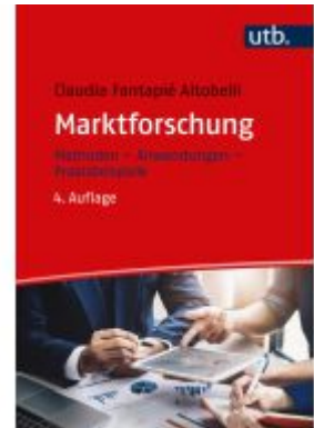
Marktforschung Ladenpreis: 65,80EUR