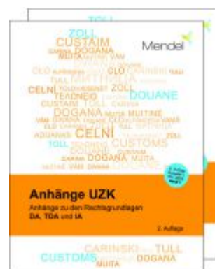
Anhänge UZK Ladenpreis: 51,30EUR