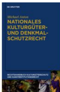
Michael Anton: Handbuch Kulturgüterschutz und Kunstrestitutionsrecht / Nationales Kulturgüter- und Denkmalschutzrecht Ladenpreis: 199,95EUR