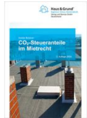
CO 2 -Steueranteile im Mietrecht Ladenpreis: 13,40EUR