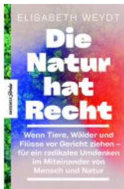
Die Natur hat Recht Ladenpreis: 20,60EUR