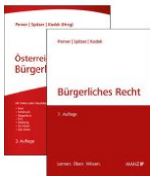
PAKET: Bürgerliches Recht 7.Aufl + Österreich-Casebook Bürgerliches Recht 3.Aufl Ladenpreis: 118,30EUR