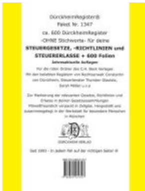
DürckheimRegister® Paket- STEUERGESETZE-RILI-ERLASSE: 600 DürckheimRegister® ohne Stichworte + 600 FOLIEN Ladenpreis: 85,00EUR