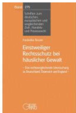
Einstweiliger Rechtsschutz bei häuslicher Gewalt Ladenpreis: 76,10EUR

Wir haben andere Produkte gefunden, die Ihnen gefallen könnten!