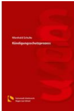
Kündigungsschutzprozess Ladenpreis: 25,70EUR