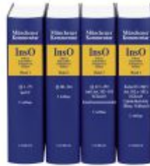
Münchener Kommentar zur Insolvenzordnung Gesamtwerk Ladenpreis: 1.003,40EUR