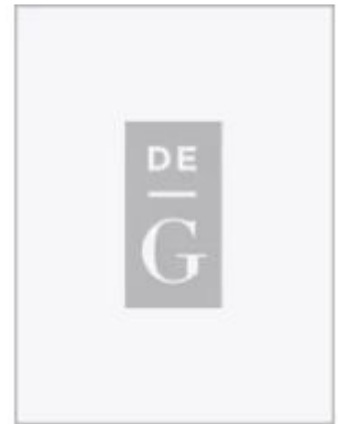
Understanding the Future Ladenpreis: 39,95EUR