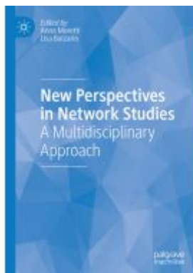
New Perspectives in Network Studies Ladenpreis: 175,99EUR