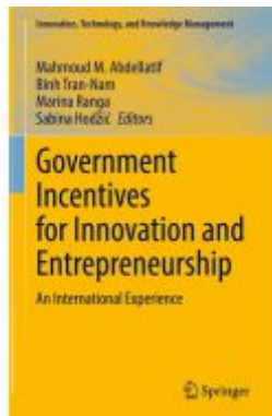
Government Incentives for Innovation and Entrepreneurship Ladenpreis: 186,99EUR