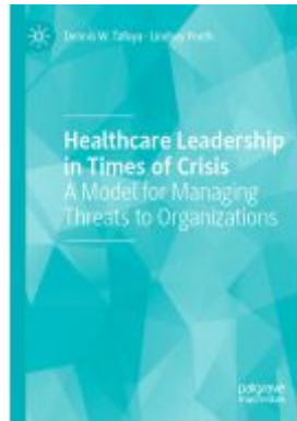
Healthcare Leadership in Times of Crisis Ladenpreis: 71,49EUR