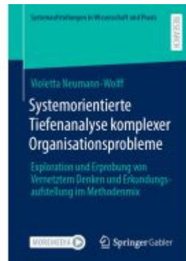
Systemorientierte Tiefenanalyse komplexer Organisationsprobleme Ladenpreis: 82,24EUR