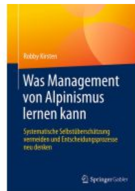
Was Management von Alpinismus lernen kann Ladenpreis: 56,53EUR