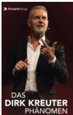
Das Dirk Kreuter Phänomen Ladenpreis: 20,00EUR

Wir haben andere Produkte gefunden, die Ihnen gefallen könnten!