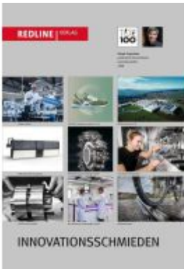
TOP 100 2023: Innovationsschmieden Ladenpreis: 30,90EUR