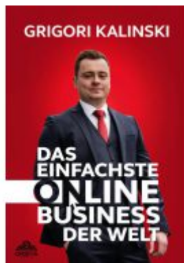
Das einfachste Online-Business der Welt Ladenpreis: 20,50EUR