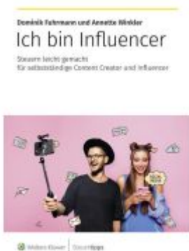
Ich bin Influencer Ladenpreis: 20,60EUR