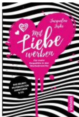
Mit Liebe werben Ladenpreis: 20,40EUR