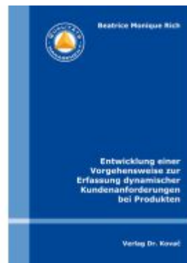
Entwicklung einer Vorgehensweise zur Erfassung dynamischer Kundenanforderungen bei Produkten Ladenpreis: 91,40EUR