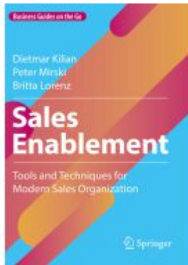
Sales Enablement Ladenpreis: 43,99EUR