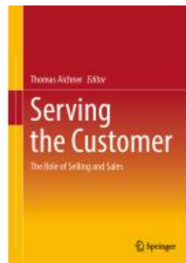
Serving the Customer Ladenpreis: 98,99EUR