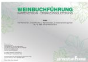
Weinbuchführung Ladenpreis: 47,30EUR

Wir haben andere Produkte gefunden, die Ihnen gefallen könnten!