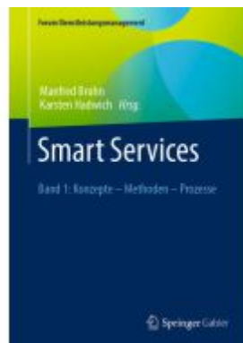
Smart Services Ladenpreis: 174,76EUR