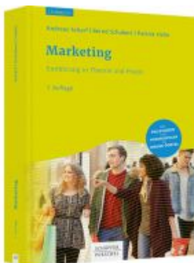
Marketing Ladenpreis: 41,10EUR