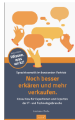
Noch besser erklären und mehr verkaufen. Ladenpreis: 19,50EUR