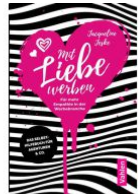
Mit Liebe werben Ladenpreis: 20,40EUR