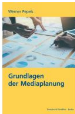
Grundlagen der Mediaplanung. Ladenpreis: 71,90EUR