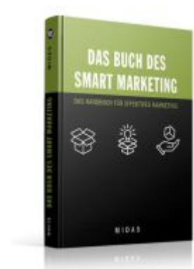
Das Buch des SMART MARKETING Ladenpreis: 15,40EUR